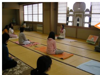
ゲストティーチャー を迎えてのヨガ教室

お母さんたちの心や体を軽くするワークショップを企画しています。 開催日についてはお問い合わせください。